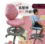
LOGIS邏爵*守習兒童椅/成長椅 二色 防水 SS100