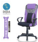
升級版★辦公椅/電腦椅【時尚美學舒壓】DIJA辦