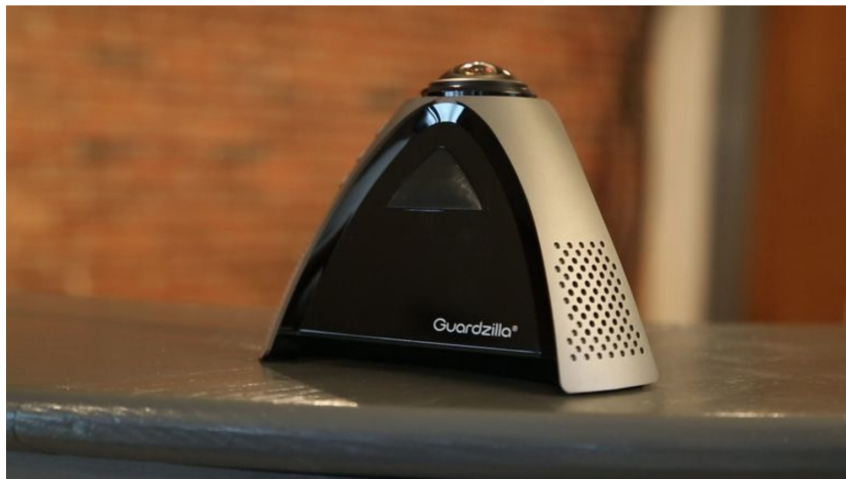
北美知名網路攝影機品牌Guardzilla，其360度全景高解析度網路攝影機即是採用物聯智慧軟體連線技術，擷取於網路。

物聯智慧指出，該公司2012年建立雲端平台，期間投入大量研發資源提升連線技術效能，並積極開發雲端服務功能，到2016年底穩步累積的設備量達1,480萬台，然今年1至10月，Kalay平台新增的設備量就已逼近過去四年所累積的數量。回顧近一年，物聯智慧積極調整經營體質，以精實的研發人力發揮最大效率，開發功能最符合市場需求的標準化平台服務，採減少客制化專案開發策略，讓研發人員可專注於提升軟體連線技術效能，拉大與同類型技術競爭者的差距，再者強化Kalay雲端平台的核心功能 - 雲端影像解決方案VSaaS 3.0。