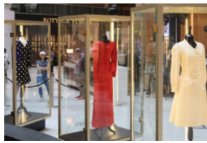
Q3經濟成長3.6% 全年估增3.7%