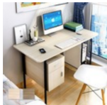
限時搶購★House-DIY 日式電腦置物架雙抽辦公桌/