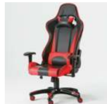
【ANGUS】G703-立體包覆電競專用椅/電競賽車椅