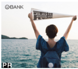
還在付3%申購手續費嗎? 金融界震撼彈!基金投資0元申購手續費!