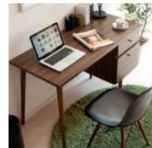
Peachy Life 曼德日系雙抽工作桌/電腦桌/書桌(2色可